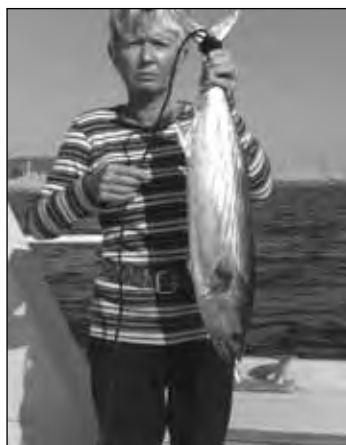
Una Palamita (sarda sarda) catturata in acque nostrane con l'aiuto dell'autrice. Un valido rimedio alla voracità del suo equipaggio.

All'inizio volevamo essere solo primi . poi anche secondi . Alla fine ci siamo impegnati e abbiamo fatto pure la pizza .