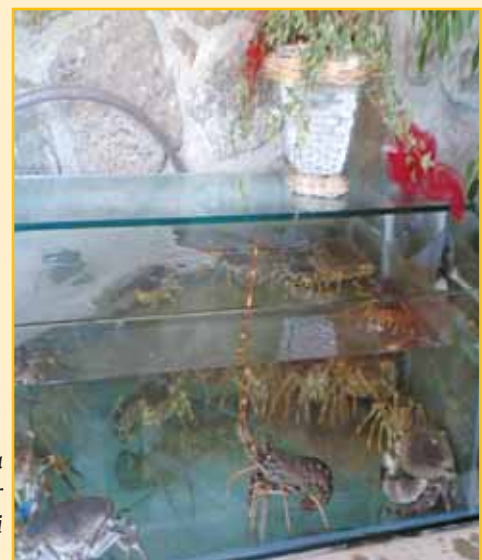
La vasca del vivo per i crostacei all'interno.