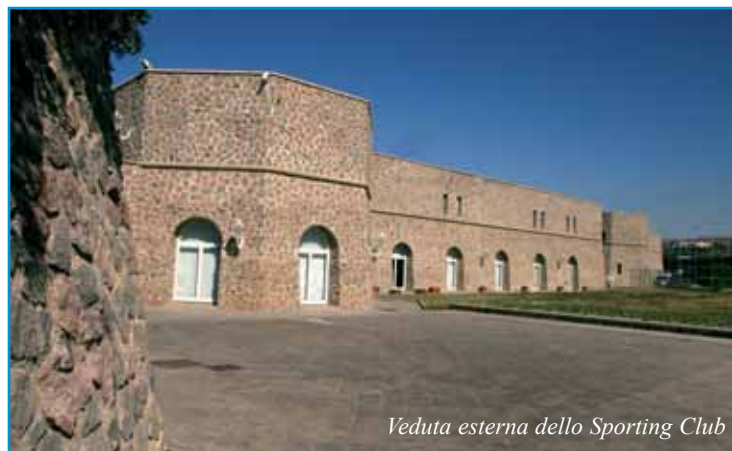
Veduta esterna dello Sporting Club

CALENDARIO: 20 gennaio, 3 e 17 febbraio, 2 e 15 marzo 2008 e dopo l'ultima prova in programma (15\03\08) la premiazione.