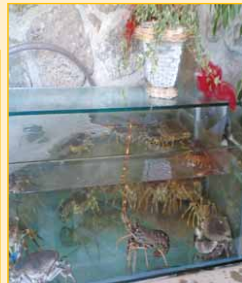
In alto, all'interno del ristorante la vasca del "vivo" per i crostacei.