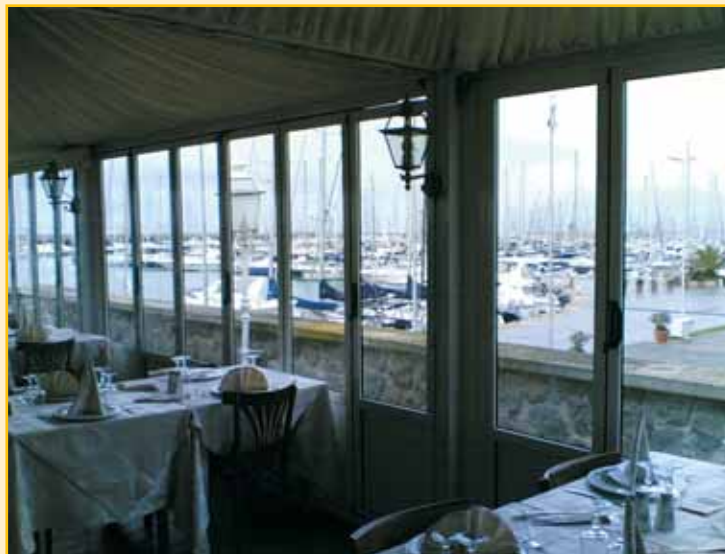
Nella foto a destra, la vista sul porto dalle finestre dei nuovi locali del ristorante.

Sentito apprezzamento da parte del nostro giornale a "La Piazzetta", a Dario ed ai suoi simpatici collaboratori per la felice, importante, metamorfosi.