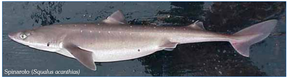
Spinarolo ( Squalus acanthias )

Soffriggere in adeguata padella olio, aglio peperoncino e carote tagliate a rondelle e far andare a fuoco medio, aggiungere la testa della cernia spaccata in 2 o più parti ed irrorare il tutto con della vernaccia. Salare q.b. inco- perchiare e lasciar cuocere a fuoco moderato fintantoché l'intingolo avrà perduto la liquidità di troppo. A cottura ultimata togliere le parti ossee della testa di cernia dopo averle opportunamente spolpate recuperando i pezzi migliori del pesce siti sugli opercoli ed in prossimità delle cavità orbitali e porli