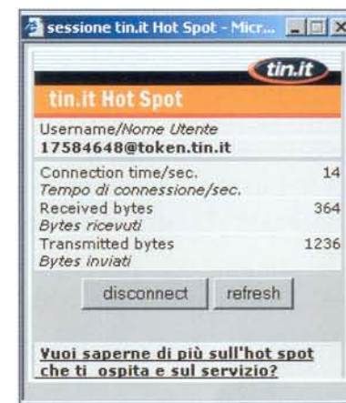
Fig. 2: Finestra di sessione

Per ulteriori informazioni sul servizio tin.it Hot Spot, per verificare l'elenco aggiornato delle aree coperte dal servizio o per scoprire le promozioni dedicate ai Clienti Tin.it titolari di un abbonamento a pagamento (Abbonamenti Internet o ADSL), consulta www.tin.it o http://tin.virgilio.it/mobile , o chiama il Numero Verde 803380 (070.5281020 da cellulare).